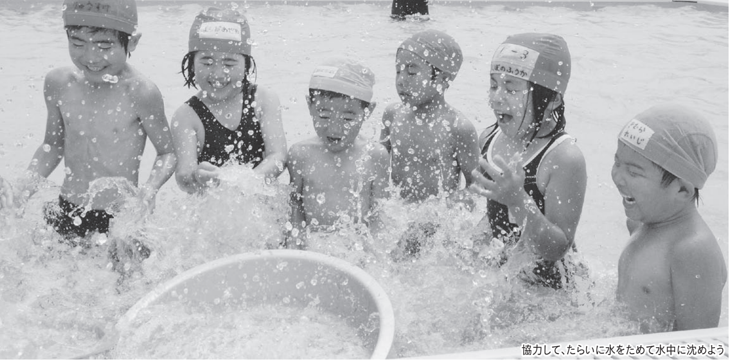
協力して、たらいに水をためて水中に沈めよう