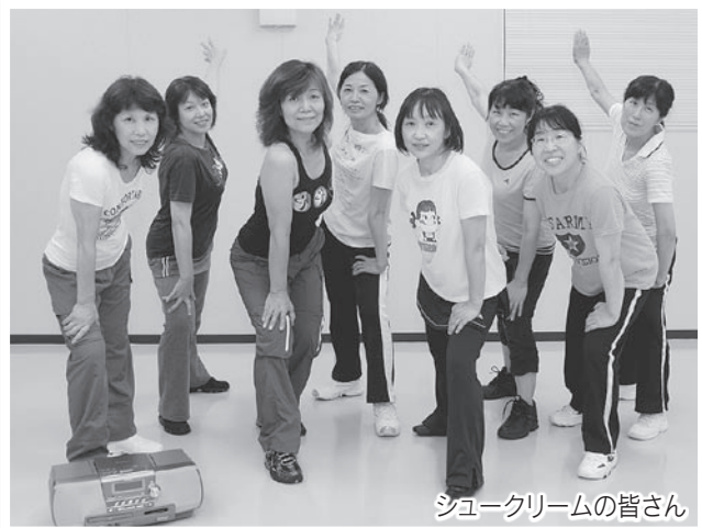
シュークリームの皆さん

会員は随時募集中、1回無料の体験入会もできます。エアロビック未経験者でも大丈夫です。まずは活動日に、浅羽北公民館へ気軽に見学に来てください。