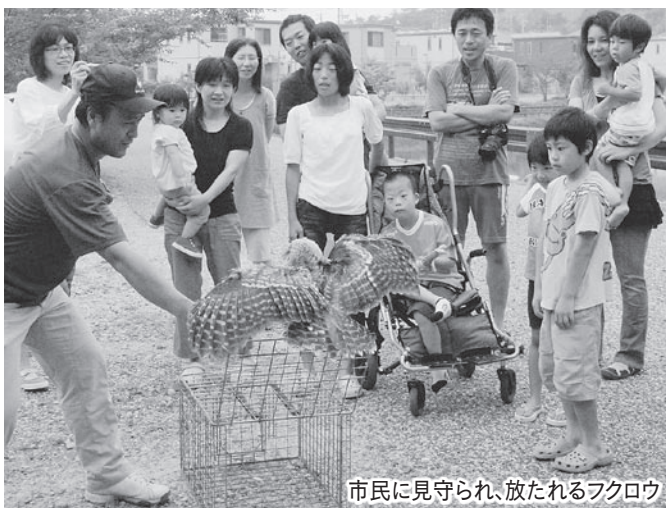
市民に見守られ、放たれるフクロウ

7月3日、小野田地区(袋井市愛野)で保護され、浜松市動物園でけがの手当てを受けていたフクロウが森へ放されました。