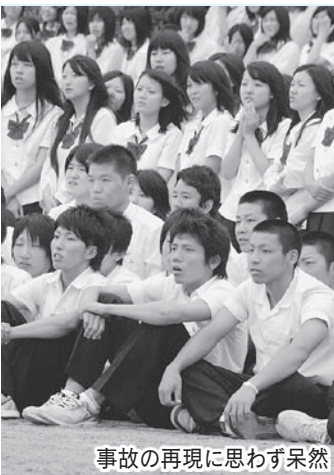
事故の再現に思わず呆然