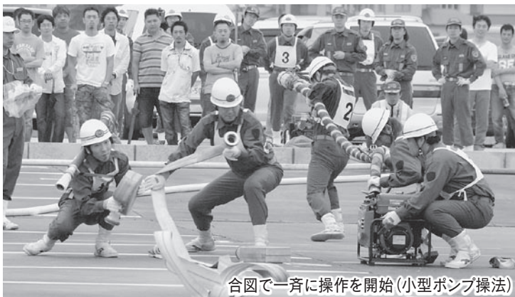
合図で一斉に操作を開始（小型ポンプ操法）