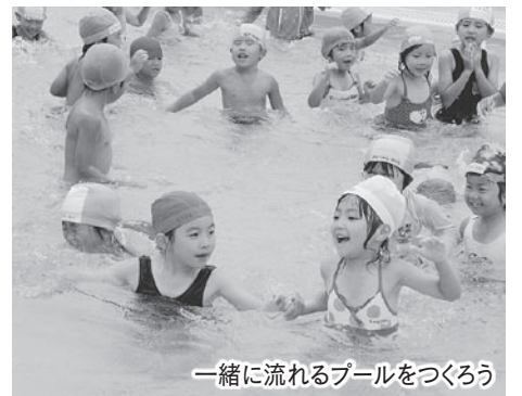
一緒に流れるプールをつくろう

隣接する幼稚園と小学校が交流を行うことで、園児が来年度入学予定の小学校を身近に感じ刺激を受けたり、園児と小学生が親しみを持てるようになったりすることを目的に行っているもので、水中ゲームなどを通して、子どもたちは、プール遊びを思う存分に楽しみました。