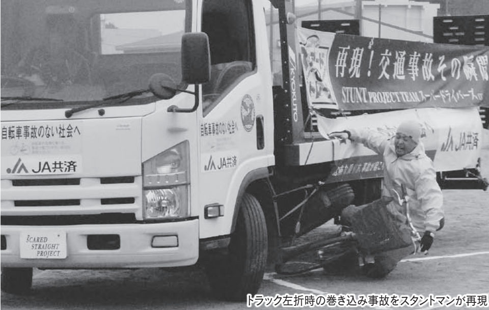
トラック左折時の巻き込み事故をスタントマンが再現