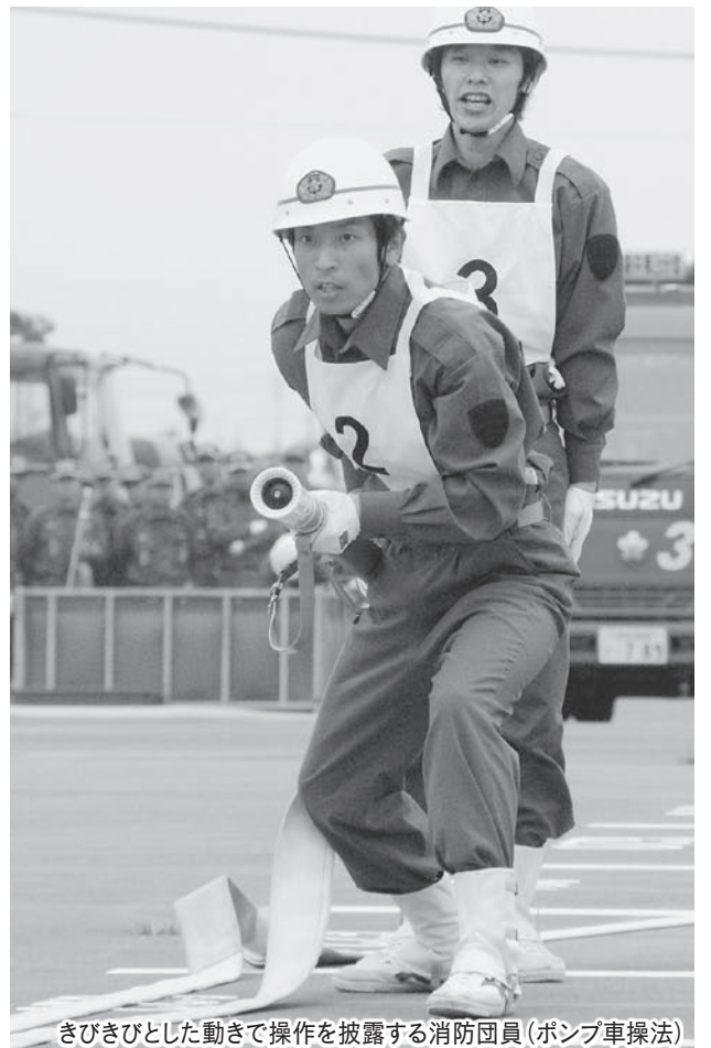
きびきびとした動きで操作を披露する消防団員（ポンプ車操法）