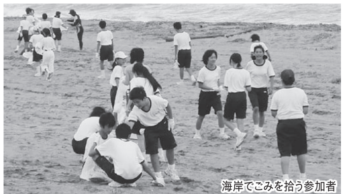
海岸でごみを拾う参加者