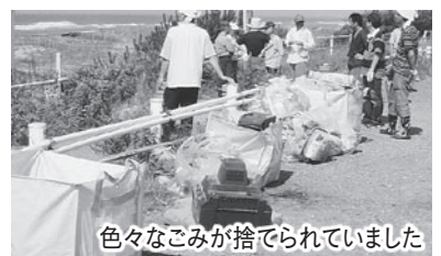
色々なごみが捨てられていました

浅羽南地区の自治会や浅羽中学校の生徒、ボランティア、サーファーなどが、約4.5キロの海岸を歩きながら、砂浜に落ちていた流木やプラスチック製品、びん・缶など、合計約8トンものごみを拾い集め、参加した皆さんは、海岸美化の大切さと浅羽海岸を後世に引き継ぐことの意義を感じている様子でした。