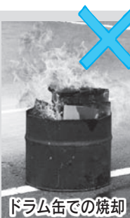
ドラム缶での焼却

A! だめです。ドラム缶の中やコンクリートブロックで囲って燃やす行為も、野焼きとして禁止されています。