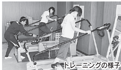
トレーニングの様子

◇スプリントマシンで「走る動作」を改善して、速く走れるようになろう。 日 12月25日(土)・26日(日) 全2日 時 午後1時30分～4時 所 浅羽体育センター2階会議室 内容 スプリントマシンなどを使ったトレーニング、50m走の測定 対象 小学5・6年生 定員 8人(申し込み多数の場合は抽選) 受講料 無料 申込方法 電話で住所、氏名、学年、電話番号をお申し込みください。 申込期間 12月1日(水)～17日(金) 持ち物 タオル、上履き、運動靴、飲み物 ☎☎ スポーツ推進課スポーツ振興係 ☎44-3129