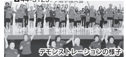
デモンストレーションの様子