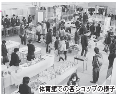
体育館での各ショップの様子