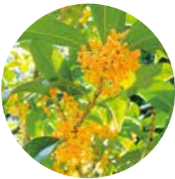
市の木・キンモクセイ 庭木として多くの家庭などに植えられ、広く親しまれています。秋にはオレンジ色の花が咲き、甘い香りが漂います。