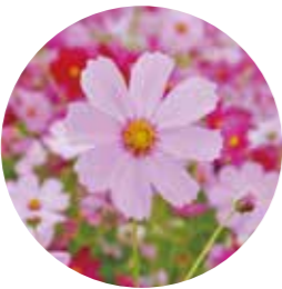
市の花・コスモス 秋になると、市内各地で彩り豊かなコスモス畑が見られます。可憐で美しく親しみやすい花です。