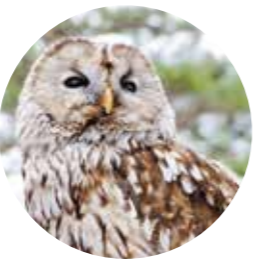
市の鳥・フクロウ 鎌倉時代の遺塵和歌集の中でも「袋井」に掛けて詠まれるなど、市名と語感的にも類似していることから親しみを感じる鳥です。