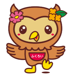
袋井市キャラクターフッピー 市の鳥「フクロウ」がベース、頭には、市の木・花「キンモクセイ」と「コスモス」の飾り。翼を広げ、元気にジャンプする姿は、飛躍する袋井市をイメージしています。