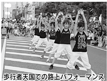
歩行者天国での路上パフォーマンス