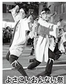
よさこいおんない祭