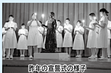
昨年の宣誓式の様子