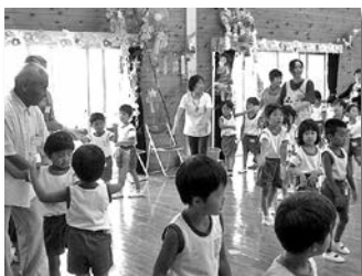
ふれあい七夕会(浅羽西幼稚園)