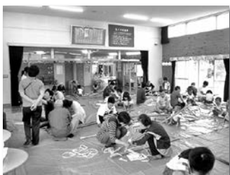
竹馬づくり(浅羽西幼稚園)

「地域を元気に」が最優先！ 地域と一体となった「地域づくり・まちづくり」 浅羽西コミュニティセンターでは、「地域を元気に」を旗印に地域活動を進めています。 地域の皆さんで組織している「ひまわりクラブ」が浅羽西幼稚園で「竹馬づくり」や「ふれあい七夕会」を開催し、地域の皆さんと園児がふれあい、楽しいひと時を過ごしました。 センターでは、今後も幅広い世代が、みんなで楽しめる交流イベントをたくさん企画し、地域の特性を生かした、地域を元気にする「地域づくり・まちづくり」を提案していきます。