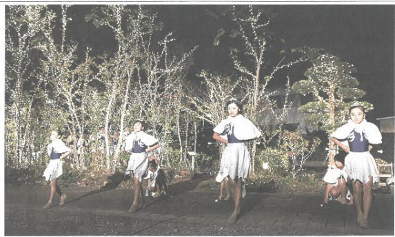
点灯された電飾の 前でパフォーマンス する小学生 — 袋井市三町