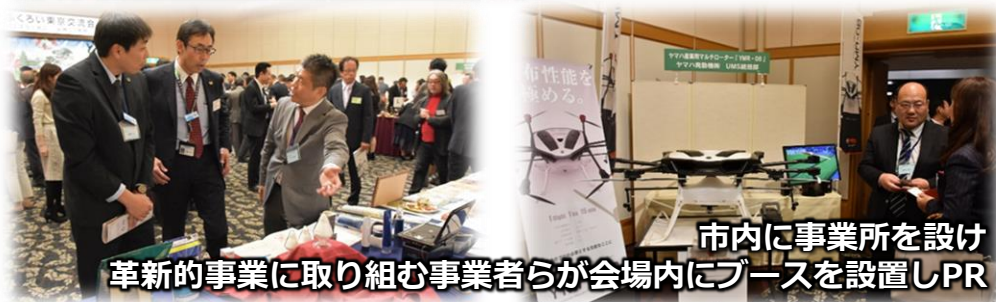
市内に事業所を設け 革新的事業に取り組む事業者らが会場内にブースを設置しPR