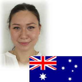
オーストラリア出身