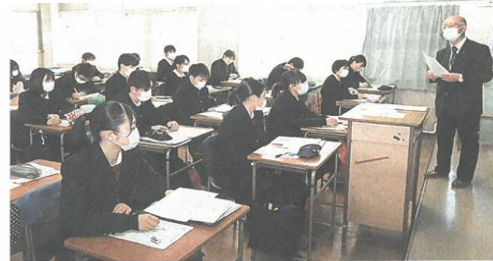
市議のアドバイスを聞く生徒 ＝袋井市の袋井高