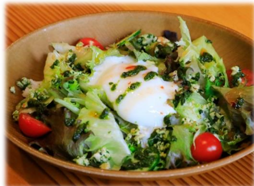
袋井の新たな名物「パクチャー丼」 B級グルメスタジアムinエコパにも出展