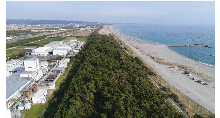
平成31年1月末の状況(袋井市湊地内)