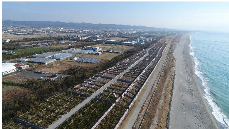
平成31年3月末の状況(袋井市湊地内)