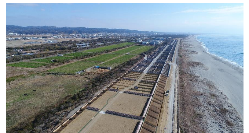
平成31年1月末の状況(袋井市大野地内)