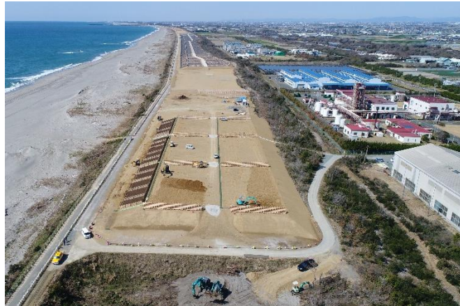
平成31年3月末の状況(袋井市中新田地内)