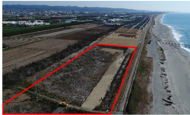
今後の施工箇所(袋井市湊地内): 受入可能土量 約5万m3