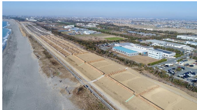
平成31年1月末の状況(袋井市西同笠地内)