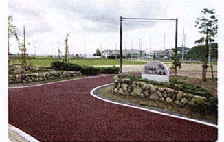
三川地区コミュニティ広場