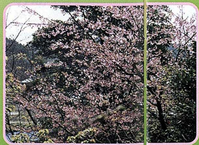
▲宇刈神社に咲く桜