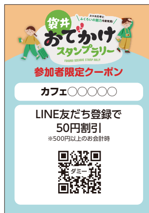
告知フォーマット例