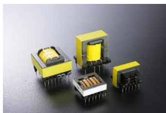
スイッチングトランス