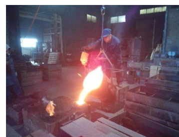
熟練工による注湯