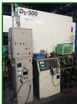
電動ダイカストマシン 500トン