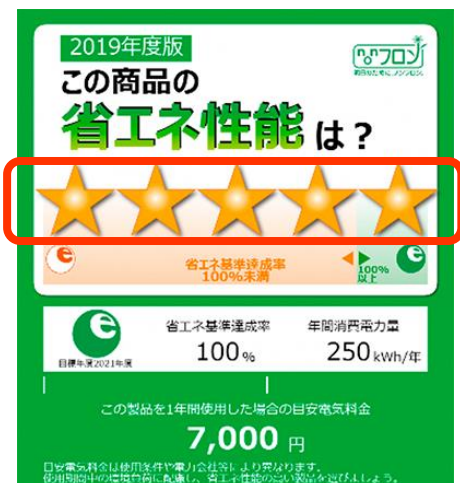
統一省エネルギーラベルのイメージ図

※統一省エネルギーラベルの対象は、冷蔵庫、照明器具、テレビ、エアコン、電気便座の5種類です。