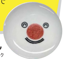
ろすのん 食品ロス削減国民運動ロゴマーク

クイズのヒントや食品ロスについては、各省庁ウェブサイト（下部2次元コード参照）や啓発資材で確認してみましょう。