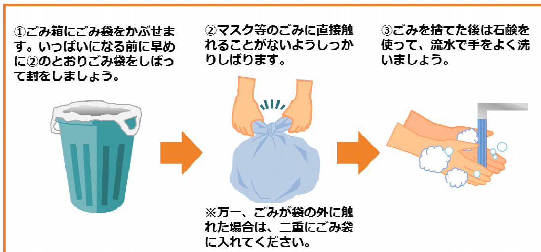
図1 新型コロナウイルス等の感染症の感染者又はその疑いのある方の使用済みマスク等の捨て方(環境省)