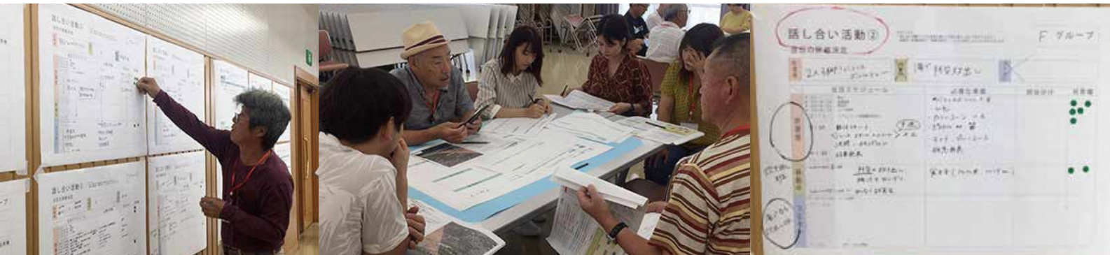
▲投票で決定した案(今後さらに準備委員会と話し合い内容を詰めていきます！)

ご意見ご感想等お聞かせください。また、WSへの参加を希望される方はご連絡ください。 袋井市建設課維持係 TEL 0538-23-7205 FAX 0538-42-3367 幸浦地域まちづくり協議会(幸浦コミュニティセンター) TEL/FAX 0538-23-7205