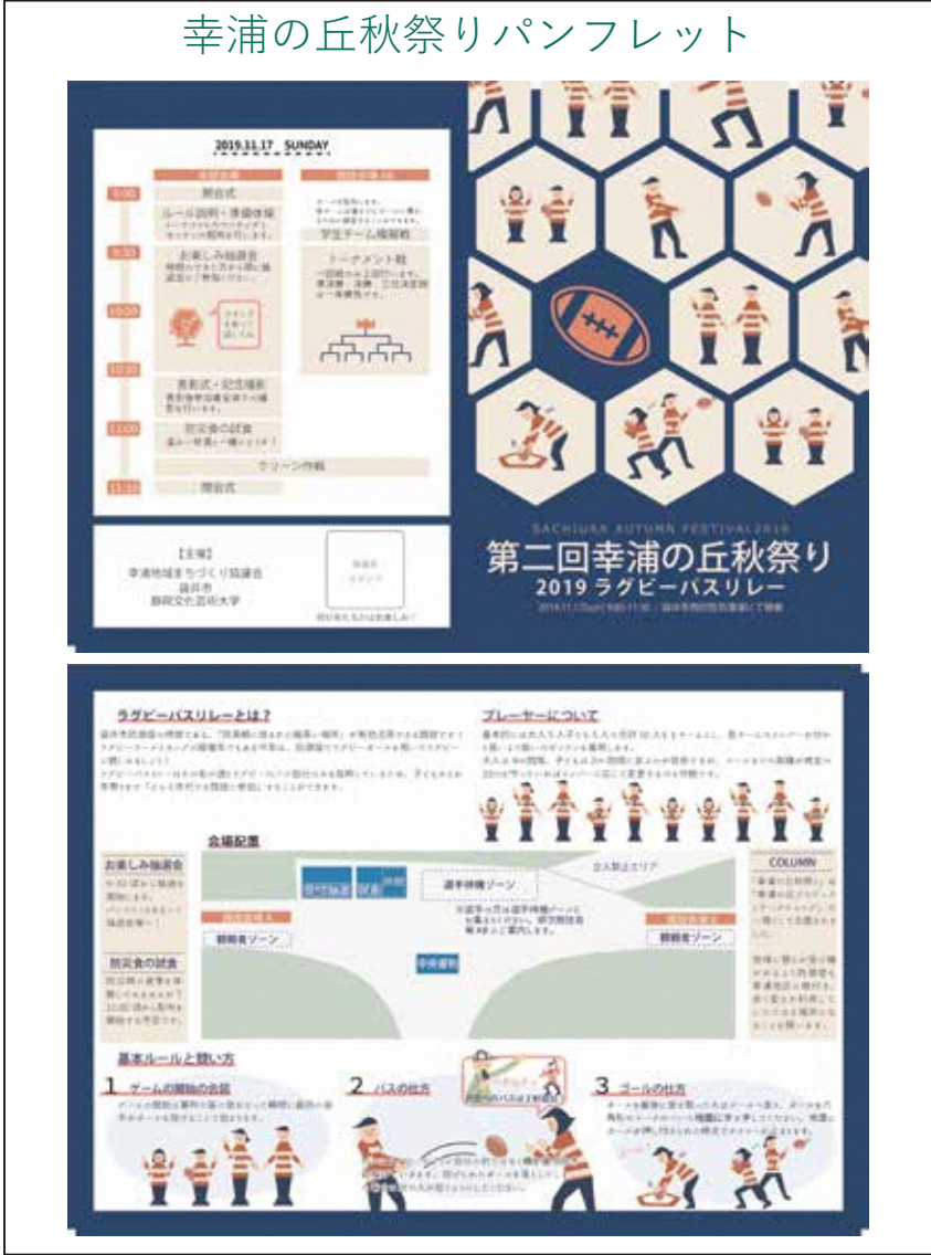
▲当日お配りしたパンフレット