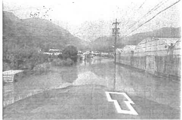
静岡市清水区の浸水被害の様子

担 当 市民生活部しあわせ推進課社会福祉係 電 話 0538-44-3121（直通） E-mail shiwase@city.fukuroi.shizuoka.jp