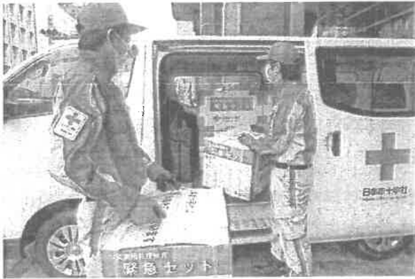
災害救援品の配送