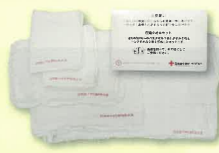
5枚のタオルが圧縮されているタオルセット