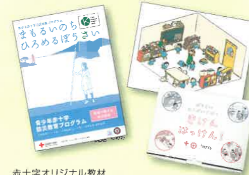
赤十字オリジナル教材

子どもたちの防災力を高めるために、青少年赤十字加盟校(園)の園児・児童・生徒を対象に赤十字オリジナル教材を通して災害時の身の守り方などの対応を広めています。