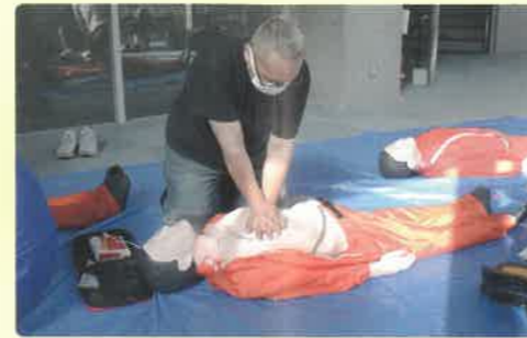
心肺蘇生の実技の様子

いのちを守る手当や心肺蘇生などの知識と技術を普及するため、講習を開催しています。令和5年度は、救急法等の講習を約680回、25,500人の方に受講いただけるよう取り組んでいきます。