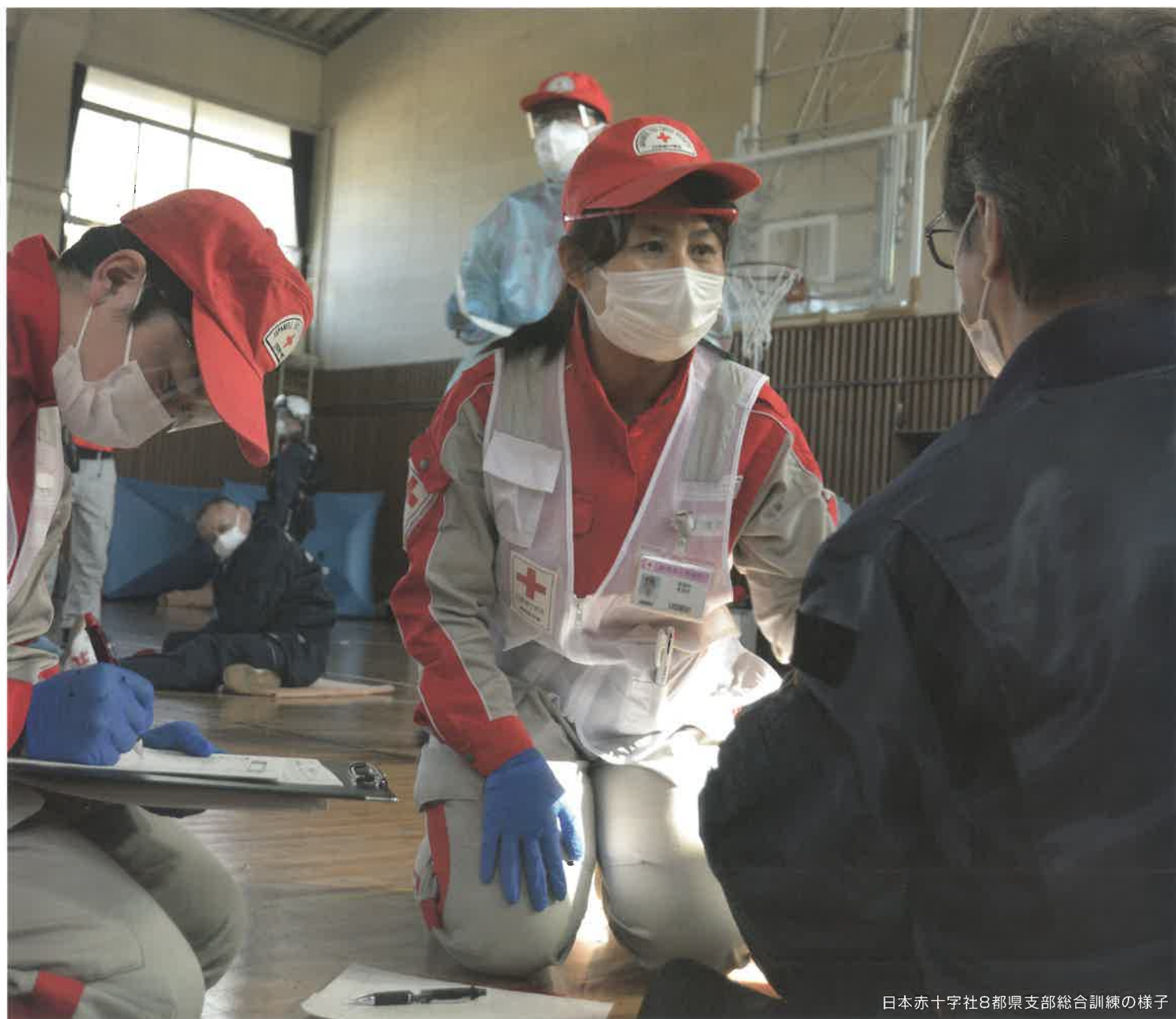
日本赤十字社8都県支部総合訓練の様子

赤十字は、大規模災害からいのちと健康を守るために 災害に備える活動を続けていきます。