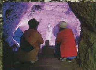
内部に祀られている地藏菩薩