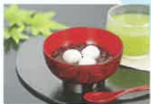
水無月ゼンザイ・冷茶