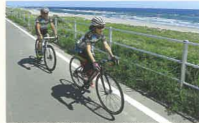
同笠海岸・太平洋岸自転車道(静岡御前崎自転車道線)

心地よい風を頬に受け、美しい田園・緑なす茶園や海岸線の風景を愉しみながら一緒に袋井路を走り抜けてみませんか。 自転車ならではの風景を満喫し、地域の人々との交流を図る「のんびり自転車旅」に是非ご参加ください。