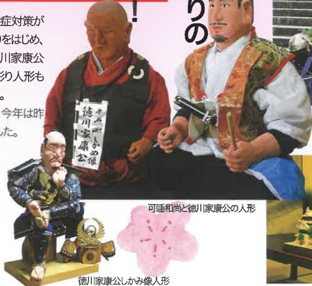
可睡和尚と徳川家康公の人形