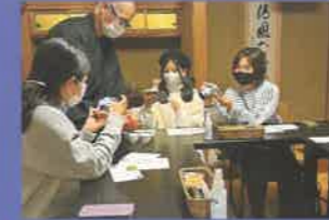
【フレ特別企画】 袋井の銘茶と法多山ライトアップに酔う夜宵 2022年12月2日開催