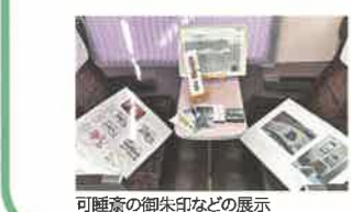
可睡齋の御朱印などの展示

JR さわやかウォーキングにあわせて、臨時の快速が三島→袋井で運行されました。乗車区間では観光特使2名が車内放送で袋井市の観光をPR。乗客には記念乗車証や袋井茶の一煎茶/バックなどが配布されました。袋井駅到着後には、可睡齋に移動し、ひなまつりや「まちひなマルシェ」を楽しんで頂きました。