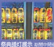
祭典提灯展示 期間中開催