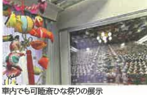
車内でも可睡齋ひな祭りの展示