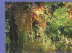
夕暮れ撮影会 ～暮れゆく袋井のステキを撮ろう～ 2023年1月21日開催