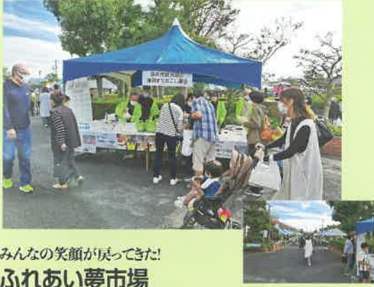
みんなの笑顔が戻ってきた! ふれあい夢市場

会場/メロプラザ・浅羽記念公園駐車場・袋井市浅羽支所・浅羽図書館 昨年は袋井市浅羽地区の特産のメロンやお茶、お米などの農産物や産業をPRし「買って、見て、知って」惣菜やスイーツなども販売。友好都市の山梨や長野からの特産品なども販売しました。もっと知る袋井スタンプラリーも開催。(2022年11月13日)今年も開催します。