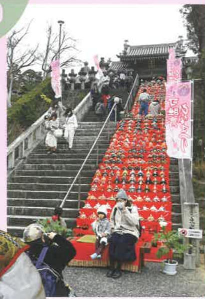
階段飾りで記念写真