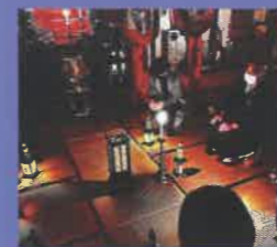
袋井怪談 ～冬の怪しがたり会～ 2022年12月10日 開催