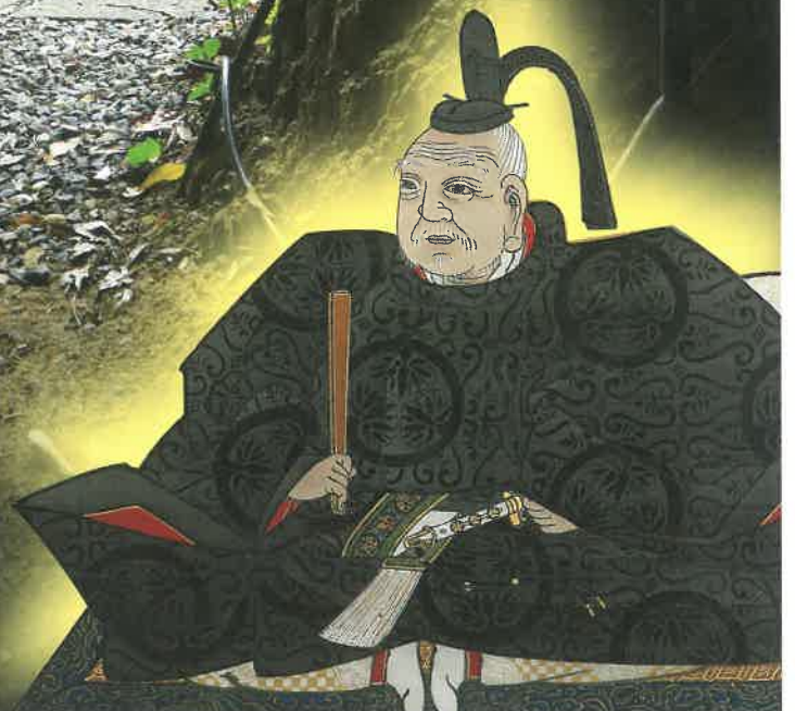
可睡齋宝物館 所蔵什物