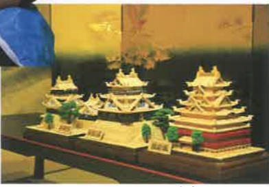
つま楊枝で作ったお城