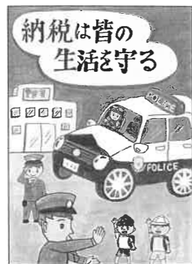
袋井西小 六年 玉井 敬大