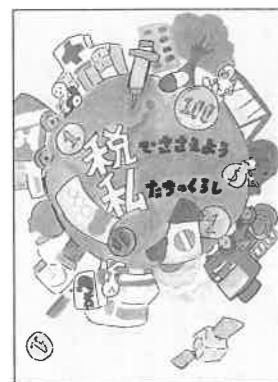
森小 六年 西村 沙那