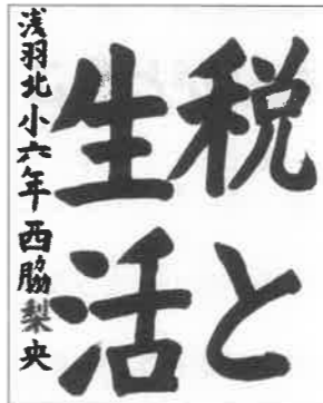
浅羽北小 六年 西脇 梨央