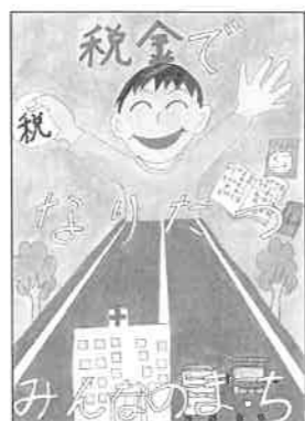
高南小 六年 村岡 想太