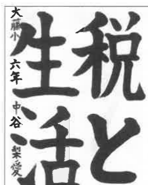
大藤小 六年 中谷 梨愛