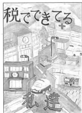
浅羽北小 六年 戸塚 糸