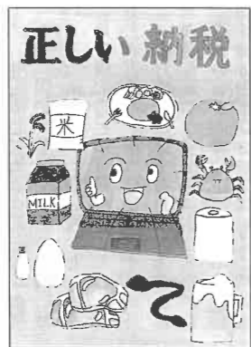
青城小 六年 山岡 陽花