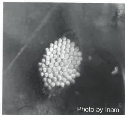
▲卵を背負うコオイムシ