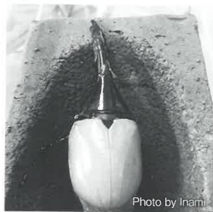
▲羽化直後のヘラクレスオオカブト

大学では、適度な自然環境下にある東海大学海洋学部で海洋土木を学びました。1年次、基礎教育科目の大切さに気が付かず、一時は大学に行く意味を模索していましたが、2年次、専門科目での講義で面白い先生(恩師)に出会い、地球環境という壮大なキーワードに魅了され、学びを深めていくことになりました。それから現在に至るまで、バイオマス、風力、波力と再生可能エネルギー、海岸工学の分野で生きています。