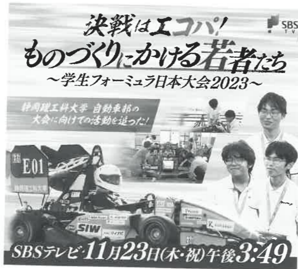
▲Youtubeから「決戦はエコパ」で検索!

*エンデュランス：2人のドライバーが交代し約20kmを走る耐久レース。走行時間によって車の全体性能と信頼性を評価する。完走しないと全くスコアが得られないため、完走できるかどうかが総合成績に大きく影響する。