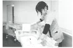
▲メディカルエイド