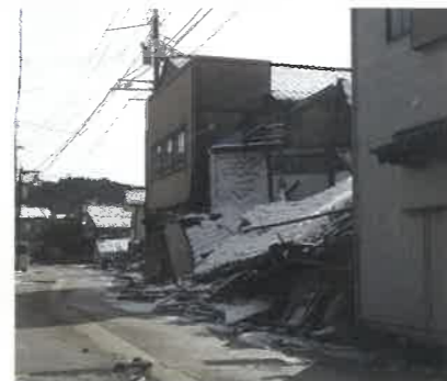
能登半島地震の被害状況