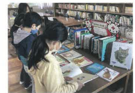
青少年赤十字文庫を楽しむ児童