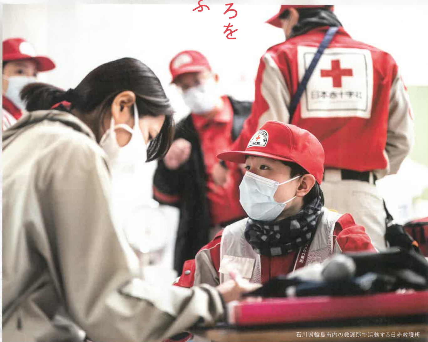
石川県輪島市内の救護所で活動する日赤救護班