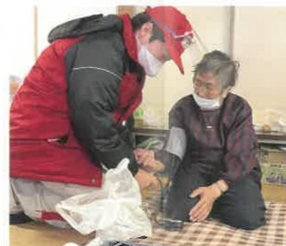
避難所での診療の様子