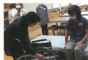
健康生活支援講習

令和6年度は、これらの講習を約600回、22,000人の方に受講いただく予定としております。「いざ!」というときのための知識や技術を広めていきます!