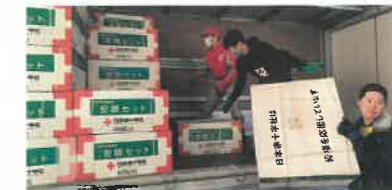
志賀町に救援品を届ける支部職員

被災された方に迅速な支援ができるよう、災害救援品を備蓄しています。能登半島地震では、石川県支部の要請を受け、1月4日に志賀町へ毛布750枚、安眠セット225セットを届けました。