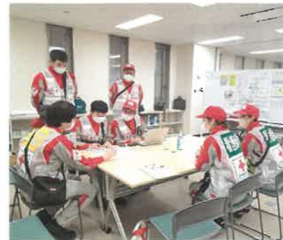
現地で打ち合わせする静岡赤十字病院救護班

令和6年1月1日に発生した能登半島地震では、被災地に救護班4班、災害医療コーディネートチーム1班を派遣しました。（1月末時点）