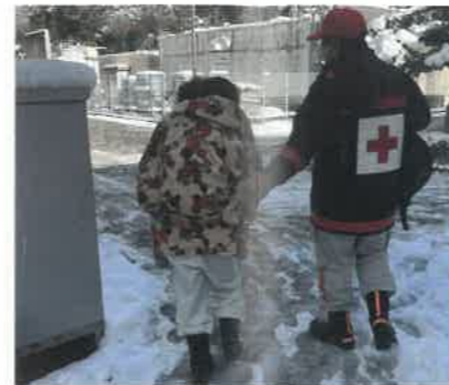
被災者に寄り添う浜松赤十字病院職員