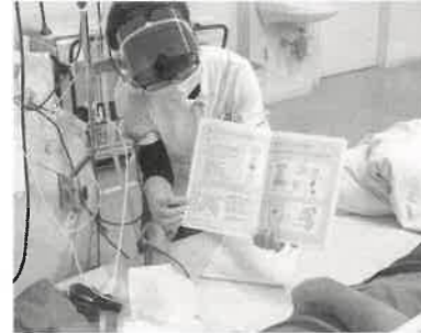
血液浄化センター看護師 CKD指導外来担当看護師

慢性腎臓病から腎不全へと進行し、透析治療が必要になる際には、患者さまもご家族も悩みや不安を抱えられます。透析治療は生活への影響が大きく、また、治療が長期にわたるため、精神的な負担を伴うこともあります。そうした患者さまやご家族のお気持ちをお伺いし、解決策を一緒に考え提案しています。透析看護師は、透析治療と生活の両面に寄り添い、患者さまが安心して治療を継続して受けられるようにサポートしていきます。