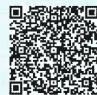
電子申請ホームページ