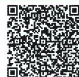
浄化槽維持管理費補助金ホームページ