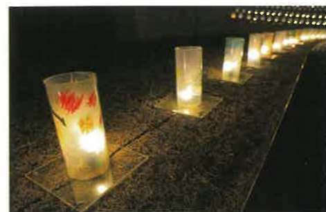
田端東遊水池公園

今年も田端東遊水池公園には地元の保育園、幼稚園など子どもたちが作った心温まる手作り行灯256基が優しくライトアップ。駅前北口にも和風の幻想的なイルミネーションが輝き、冬の夜の袋井に灯りを楽しむひとときを演出しました。