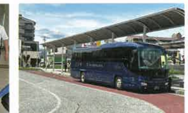
ザ・ロイヤルエクスプレス専用バスで市内観光へ