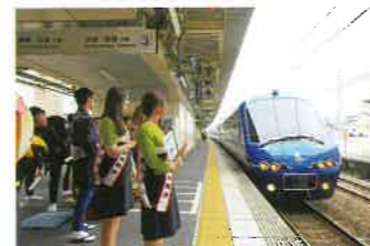
ザ・ロイヤルエクスプレス出迎え風景