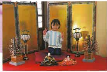
お雛様と触れ合いコーナー