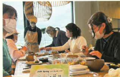
味噌玉作りワークショップ