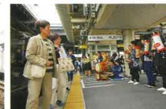
地元祭り青年による道囃子(みちばやし)の演奏