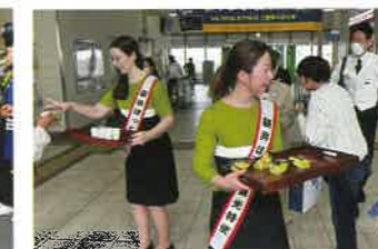
クラウンメロンふくろい茶でのおもてなし