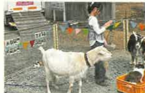
西楽寺 馬とび〜子供のポニー無料体験〜