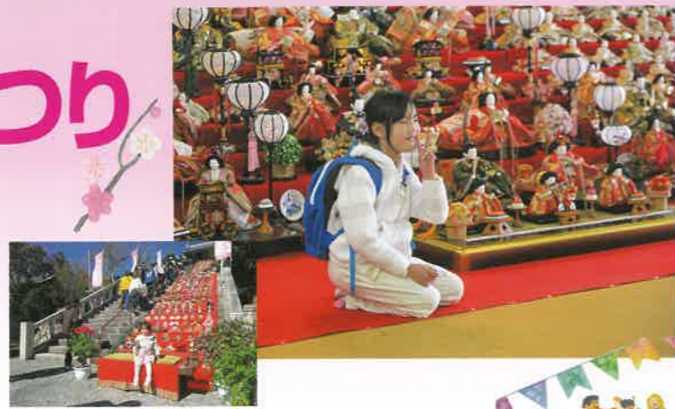
階段飾りの前で記念写真

今年の可睡齋ひなまつりでは、五感で楽しむひな祭りとして、32段の大雛壇に加え、絶景の階段飾り、艶やかさと香りを楽しむ室内牡丹、目と舌で味わう精進料理、限定の塩みたらし団子もあらたな和スイーツとして創作、お雛様と触れ合う思い出作りの場所なども創設し約30,000人以上の来場者に春の袋井を楽しんで頂きました。