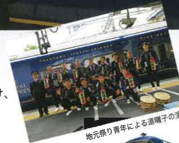
地元祭り青年による道囃子の演奏

静岡県の各エリアを周遊しながら3泊4日の旅を実施する「ザ・ロイヤルエクスプレス」が5月25日から5週続けて、袋井駅に停車しました。初日は、ほっと観光特使も応援に駆けつけ、市では、ツアー参加者の皆さんがJR袋井駅で下車する際に、本市の特産品であるクラウンメロンやお茶でのおもてなしのほか、地元祭り青年による道囃子(みちばやし)の演奏、市キャラクターフッピーなどでお出迎えました。ツアー参加者の皆さんは、その後、専用バスで市内を観光し、葛城北の丸に宿泊されました。