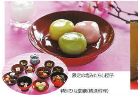
限定の塩みたらし団子