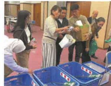
ごみの分別を体験！