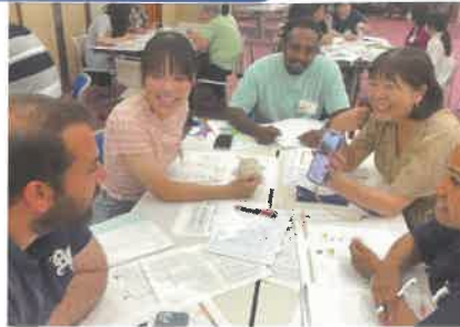
日本語ではなそう♪