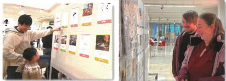
昨年度の展示会の様子