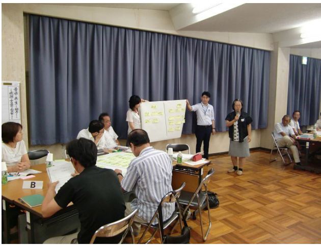
今回出された意見を「(仮称)袋井西コミュニティセンター」の構想や計画へ反映させていきます。

公民館の建て替えの計画がある袋井西地区では、建て替えを契機に、現在の公民館の現状と課題を地域の人同士が意見交換し、どのような地域づくりに取り組んでいけばよいかを話し合っています。