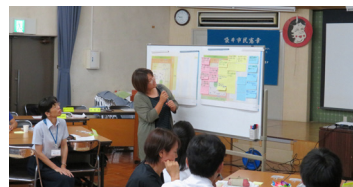
グループ代表者が発表

事務局からプロポーザル案の説明を行い、参加者はグループに分かれ、プロポーザル案について、自由に話し合いました。意見の中には、階数についてや安全性、防災、設備関係など様々な意見が出ました。