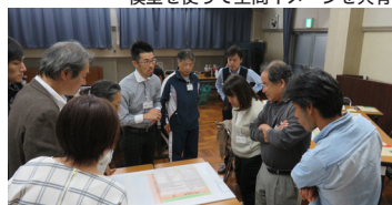
グループを超えて議論を交わしている風景

これまでに出了意見への対応方法や検討内容を踏まえた基本設計方針（案）の説明をしました。計画の軸となるコンセプトやプランは、プロポーザル案を基本としながらも、ワークショップメンバーの夢や希望が詰まった様々な意見や要望を反映させた基本設計がまとまりました。