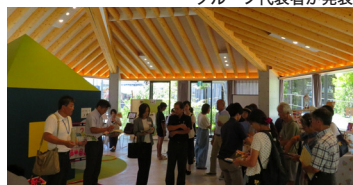
サーラプラザ佐鳴台を見学

参考事例として、豊岡中央交流センター、春華堂 niceo、サーラプラザ佐鳴台を実際に見学しました。特徴があり、性格が異なる建物でしたが、新しいコミュニティセンターのイメージをメンバーで共有することができました。