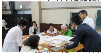
模型を使って空間イメージを共有

前回までのワークショップを踏まえて、施設の具体的な活動について話し合いました。大ホール、オープンスペース、キッチンスタジオについての意見が多く挙げられ、現在の利用状況や課題を踏まえた意見交換ができました。