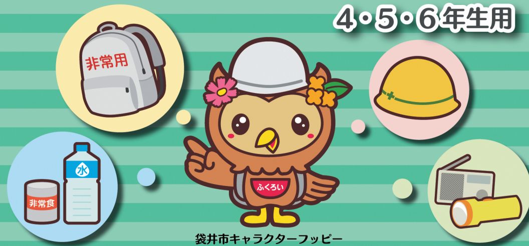
袋井市キャラクターフッピー