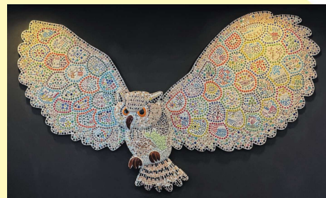
「ふくろい四季のつばさ」2024

今年度は、昨年度に引き続き、さわやかアリーナに設置する新たなパブリックアートに取り組めます。透明でカラフルなカットティングシートを使って制作し、その後みなさんの作品が集まり、さわやかアリーナの窓ガラスを彩る一つの大きなアートになります。