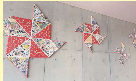
「元気をはこぶかざぐるま」2025