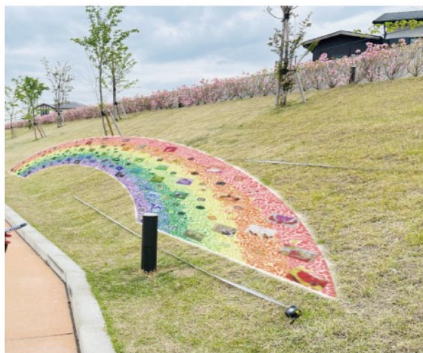
※現在進行中の作品イメージ