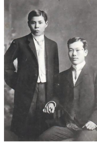
Kỳ ngoại hầu Cường Đế (trái) và Phan Bội Châu (phải)