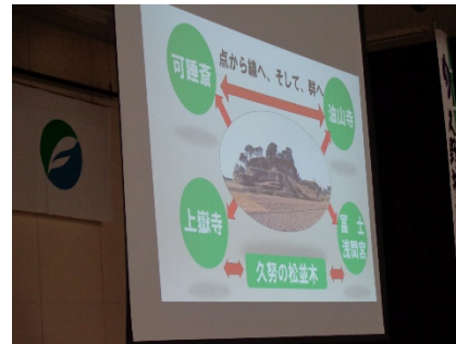
久野城址と周辺遺産との連携

コロナ禍ではありますが、令和3年度の通常総会を5月29日（土）に実施しました。令和2年度の行事はほとんど中止となり、城址の草刈り等限られた活動のみを行いました。令和3年度も同じような状況になるかと思いますが、通常の生活に戻るまで、できる活動を工夫して会員の意識が停滞しないように実施していきたいと思っております。