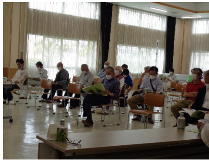
総会への参加者（43名）