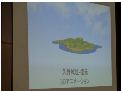
久野城址3Dアニメーション