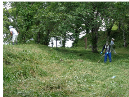
本丸から二の丸付近