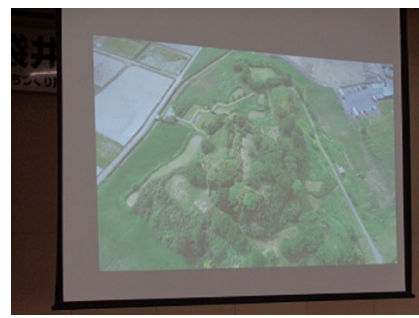
久野城址ドローンでの空撮