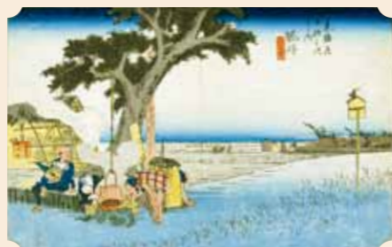
『保永堂版東海道五十三次 袋井 出茶屋之図』 初代広重