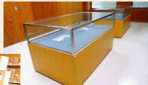
袋井に関係の深い歴史資料を展示しています。