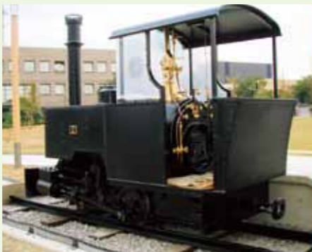
駿遠線の歴史とともにかつて大活躍したバグナル社(イギリス)製の機関車を模したモニュメント。