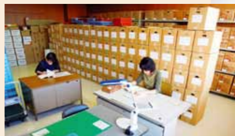
歴史資料の保存や調査を行っています。