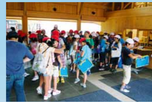
エントランス 明るく日ざしがみなさまをお迎えします。