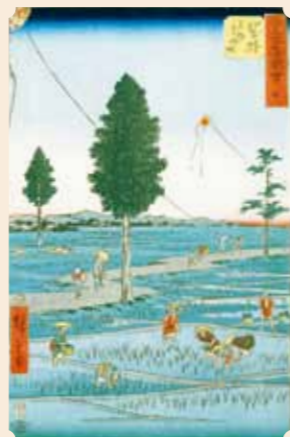
『五十三次名所図会 袋井』 初代広重