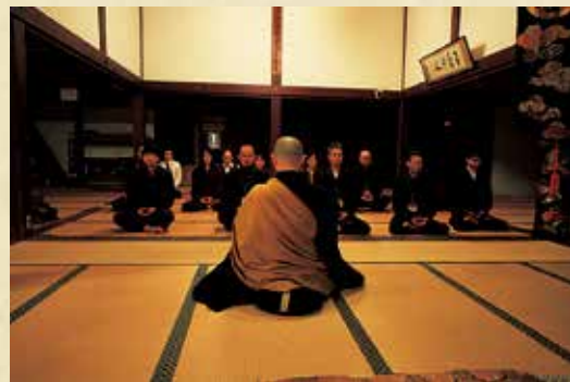
坐禅 夜晚坐禅叫做“夜坐”, 早晨的坐禅叫做 “晓天禅”。