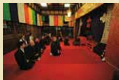
学习佛像知识 学习佛像的寓意、 形状, 领会佛像的深髓。