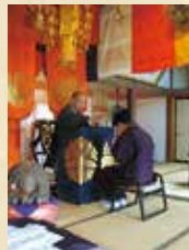
发心式 穿着僧衣, 准备参加僧侣仪式。