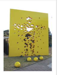
7「空き地サッカークラブ」