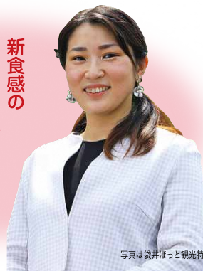
写真は袋井ほっと観光特使