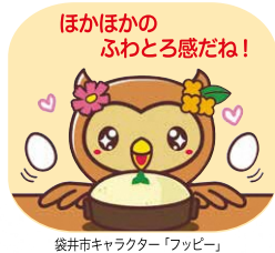
袋井市キャラクター「フッピー」

●お食事処 山田 たまごふわふわ 350円 袋井市豊沢 2750 TEL 0538-42-2057 時間 10:00~15:30 休日 原則木曜 ※土、日、祝、12月~2月上旬及びイベント時はお休み