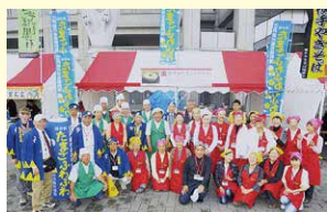
B級グルメ 袋井宿「たまごふわふわ」サポーター

200年以上の時を経て袋井の新名物「ご当地B級グルメ」として全国的に知られ、人気アニメにも登場。