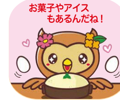
袋井市キャラクター「フッピー」