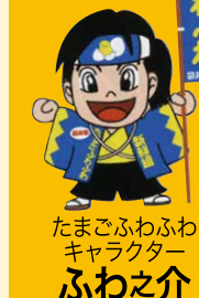
たまごふわふわキャラクター ふわふわ之介