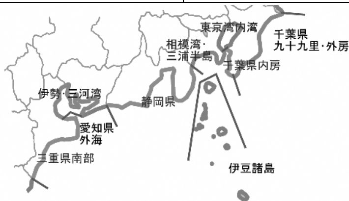
第1図 静岡県及び周辺の県が属する津波予報区