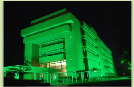
2021年市役所グリーンライトアップの様子

アイルランド音楽の演奏に合わせて、市役所庁舎をアイルランドカラーの緑色にライトアップします。