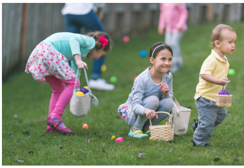
エッグハンティング